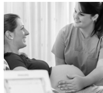
GROSSESSE & POST PARTUM

Orientation : Prise en charge du post-partum