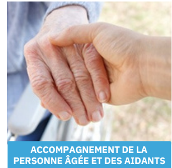
ACCOMPAGNEMENT DE LA PERSONNE ÂGÉE ET DES AIDANTS